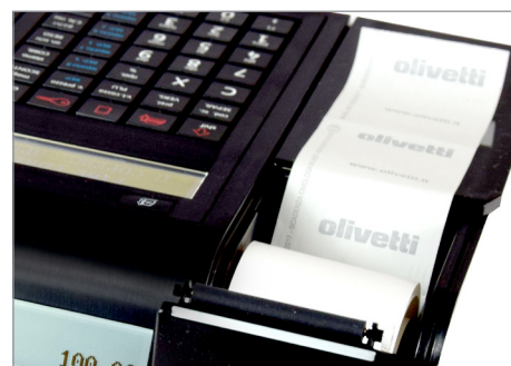
Inserimento rapido e agevole del rotolo carta