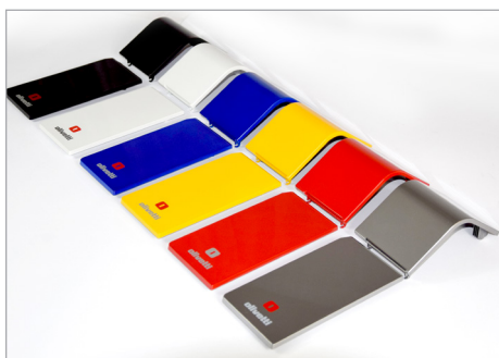
Design moderno e look personalizzabile